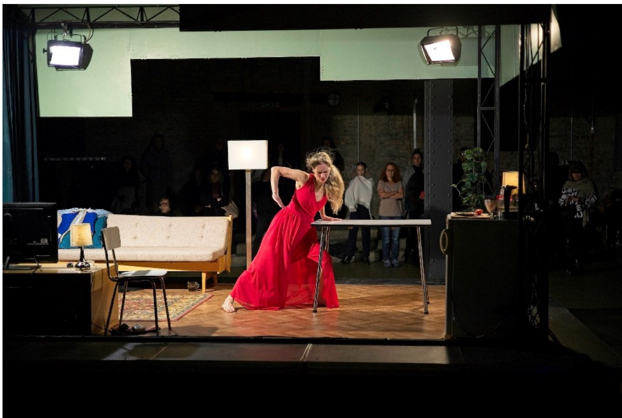
Invisible II. v Ostravě

Když mi bylo deset nevěděla jsem co budu dělat potom. Prostě jsem byla tady a teď a ono se to dělo. Vždycky se našel někdo, kdo mě postrčil o kus dál, kdo mi dobře poradil. Ta pokora k tomu patří... Zachovat iluzi. Nedat najevo tu bolest. Při variaci člověk na bolest zapomene. Je k tomu vychovávaná od malička. Neumím se za sebe moc postavit. Nemám tu ambici. Ale bylo to krásných 18let. A pak se to najednou stalo. Sebrali mi role, odstříhli mě jako miminko od maminky. Kostýmy přešli, korunky jsem vrátila. Skončila jsem do ticha. Bolelo to. Ale já vydržím hodně. Musím to vydržet!