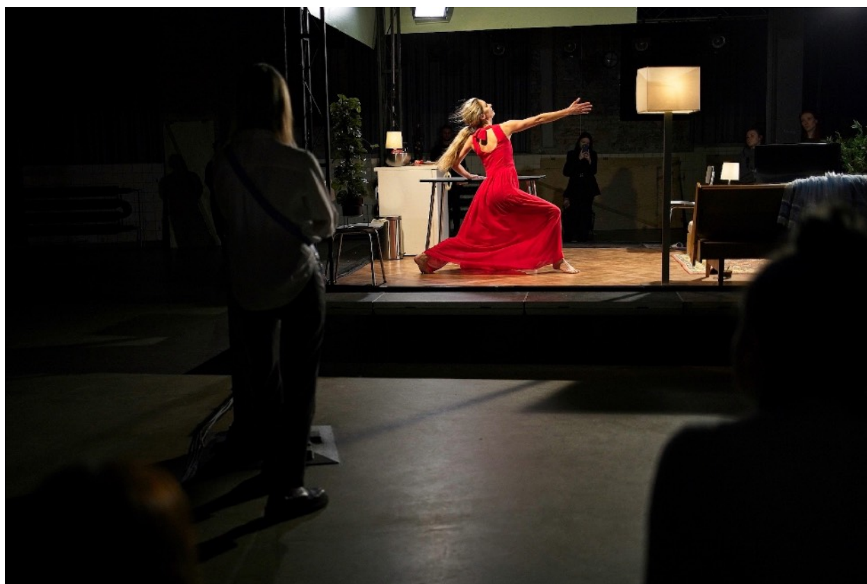
Invisible II. v Ostravě

Představení vzniká v koprodukcí s Palácem Akropolis a za podpory ministerstva kultury ČR a hlavního města Praha.