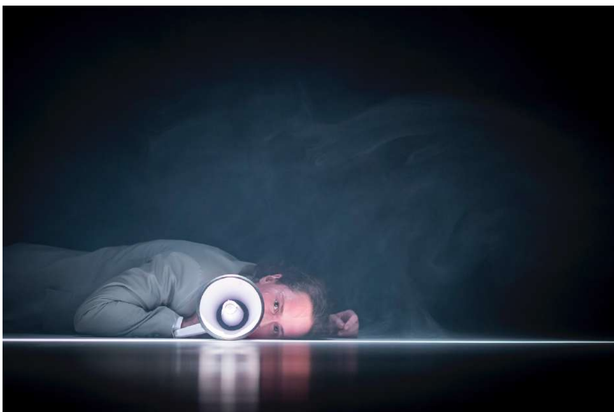
Emergency Dances I. / Patologie médií: Jáma Lvová