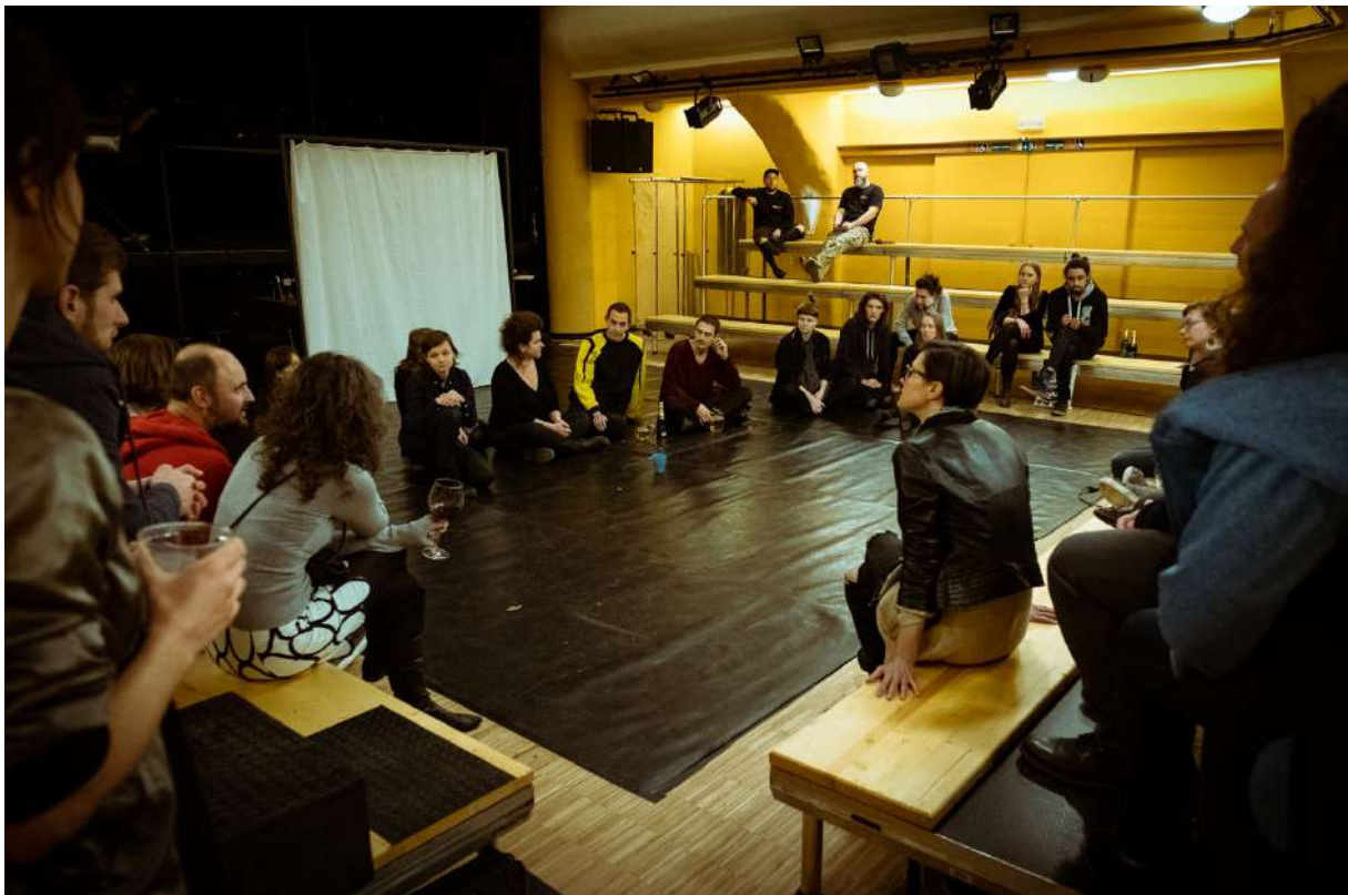
Diskuse po Emergency Dances II., foto: David Konečný

Během roku 2017/2018 soubor Tantehorse intenzivně pracoval s vybranými třinácti mladými umělci (s devíti tanečnicími a čtyřmi výtvarnicími), kteří se scházeli v intenzivních blocích a tvořili výzkumně tvůrčím způsobem pod vedením rozličných osobností z oblasti divadla, tance, výtvarného umění, psychologie, sociologie a hudby a sbírali zkušenosti pro vlastní autorskou taneční tvorbu.