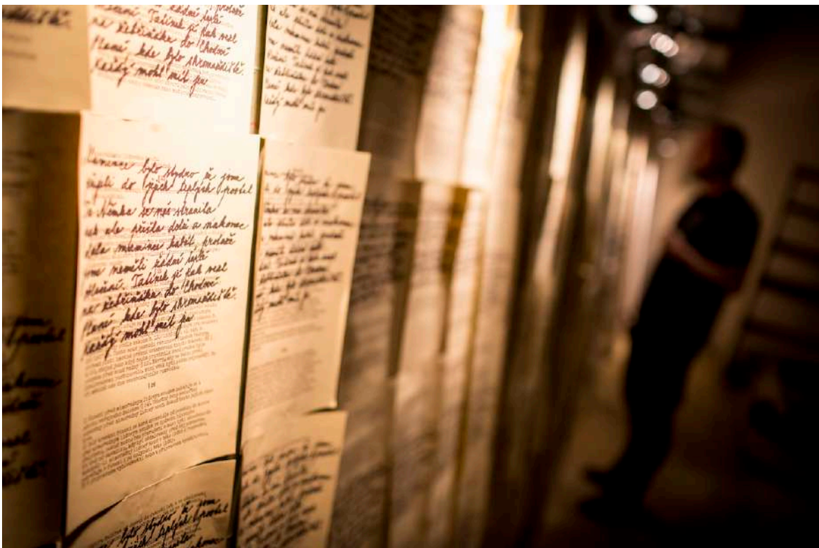
Osudety: In the Middle of Nowhere

Vždy jeden divák prochází prostorem, jde ve stopách Marthy, prožívá její dětství, cestu z jihu Francie do poválečného Československa, zabydluje tajemný dům v Sudetech, o jehož původu zatím nic neví a prožívá půl století všednodenního života v jednom příhraničním lázeňském městečku. Malé dějiny jednoho lidského příběhu.