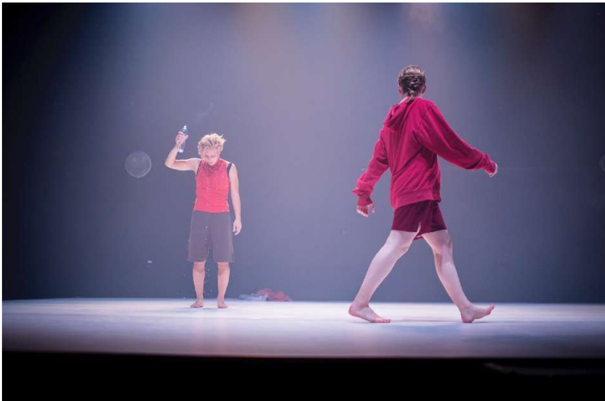
Emergency Dances I. / Patologie médií: ENTENTIKY