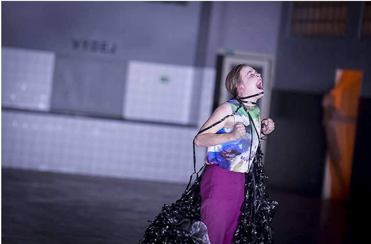
Family Therapy / !O!, foto: Vojtěch Brtnický

Projekt se uskutečnil v nedivadelním prostoru. Ojedinelý prostor bývalé jídelny a kuchyně se využil do nejmenších detailů. Díky intenzivnímu práci mohli tvůrci plně využít potenciál prostoru.