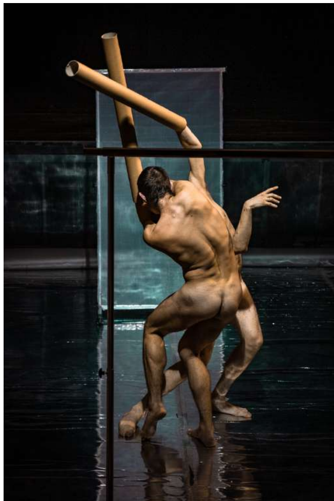
Emergency Dances II. / Limity Tělesnosti: Homo Sensorium

Naštudovanie tanečného predstavenia podporil z verejných zdrojov formou štipendia Fond na podporu umenia