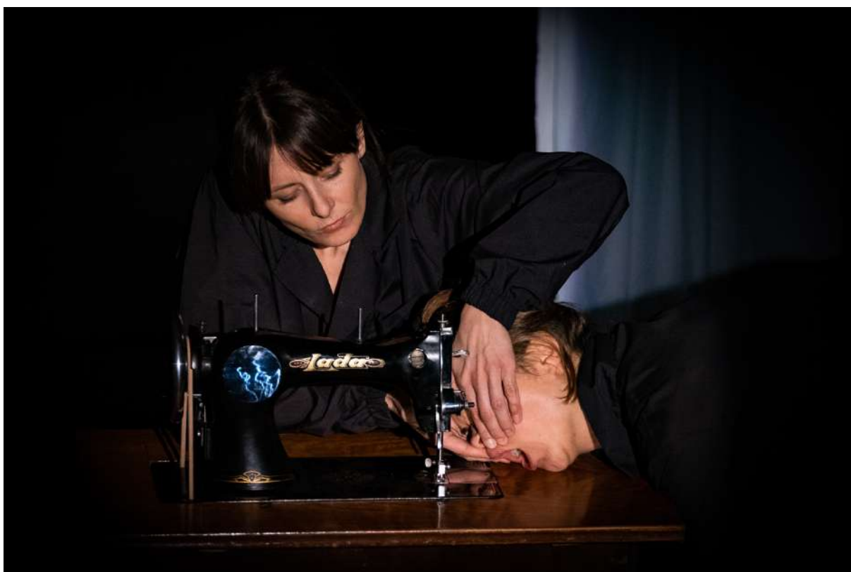
Emergency Dances II. / Limity Tělesnosti: Druhá kůže