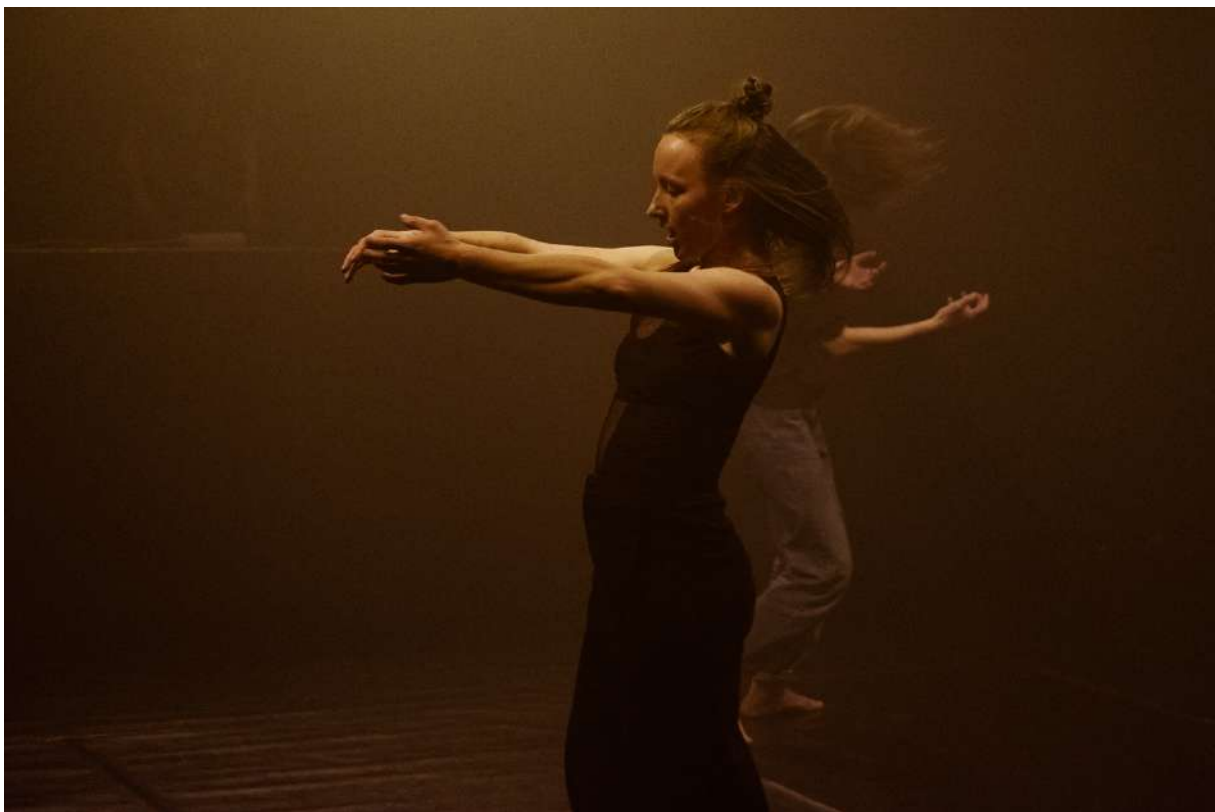
Emergency Dances II. / Limity Tělesnosti: Not to Take a Prayer

Umělecké uskupení Tantehorse se opět představilo v roli kurátora, který iniciuje setkání rozličných tvůrců v jednom tematicky laděném večeru. Tématem druhé série Emergency Dances II. byly Limity tělesnosti . Vybraní tvůrci představili tělesnou zkušenost z odlišných a ryze osobitých úhlů pohledu: tělo jako architekturu, tělo je spirituální entitu a tělo jako společensko-politický nástroj.