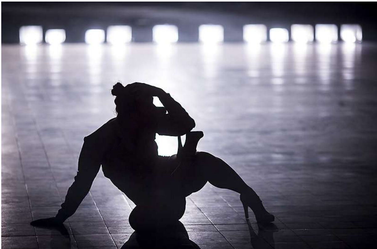
Family Therapy / !O!

Projekt !O! s pracovním názvem Family Therapy je divadlem události. Nachází se na pomezí performance, instalace a happeningu. Je to taneční architektura mezi skutečností a snem ohledávající téma šílenství a psychické nemoci z perspektivy umění jako diagnózy.