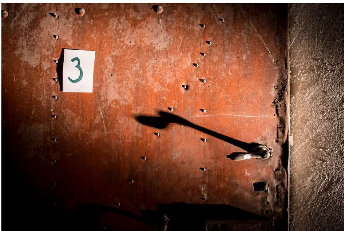
Osudety: In the Middle of Nowhere