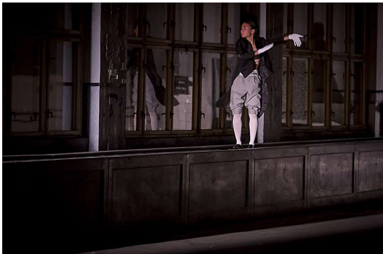
Family Therapy / !O!

Skupina Tantehorse se dlouhodobě zabývá autorskými inscenacemi na pomezí dokumentu, fyzického a tanečního divadla a performance. Její hlavní cíl je umělecké uchopení společensky angažovaných témat a překračování zavedených žánrů.