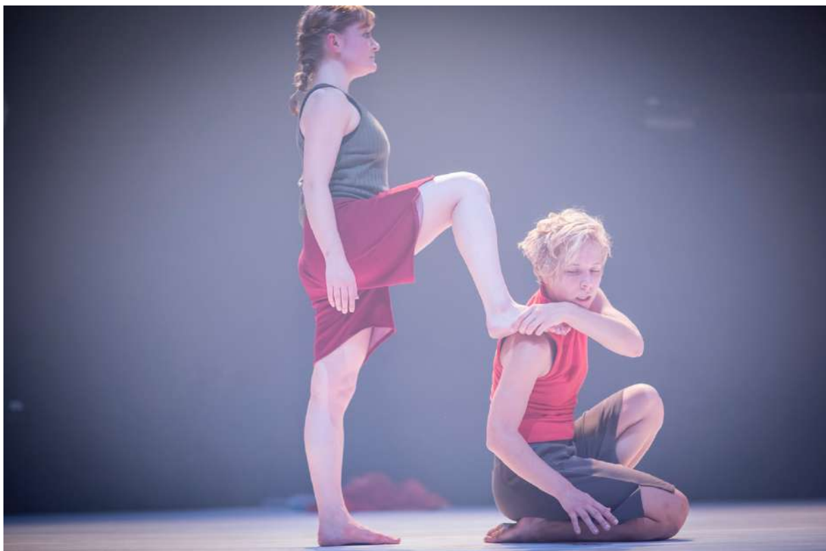
Emergency Dances I. / Patologie médií: ENTENTIKY