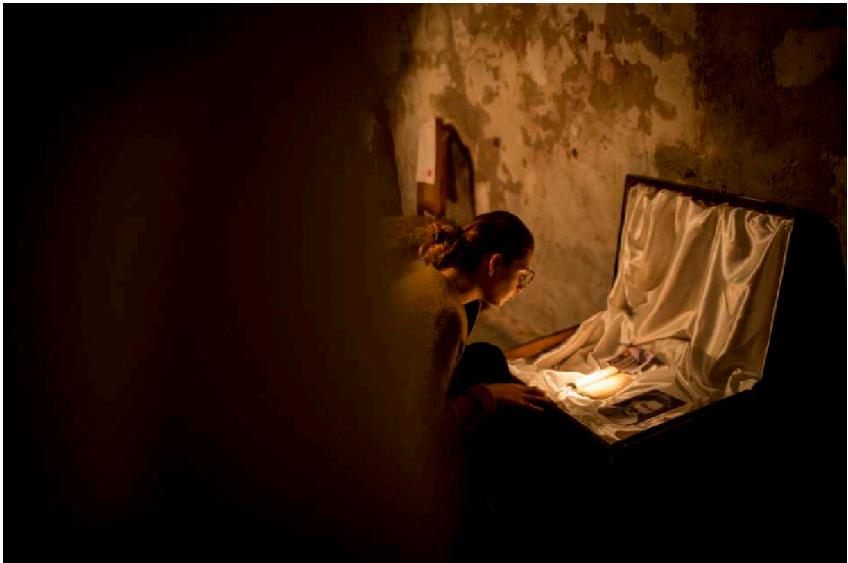
Osudety: In the Middle of Nowhere

Skrze fragmenty audio a vizuálních vjemů a vlastní imaginace si divák skládá příběh, postupuje jako při detektivním pátrání, kdy míra rozkrytí příběhu závisí na zvědavosti a aktivitě samotného diváka.