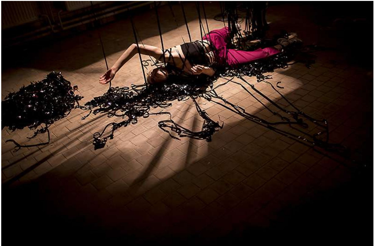
Family Therapy / !O!

inspirována nejen tématem, ale i prostorem samotným, proto do něj perfektně zapadla a všechny byla využita do samotné inscenace, nešlo pouze o okrasu.