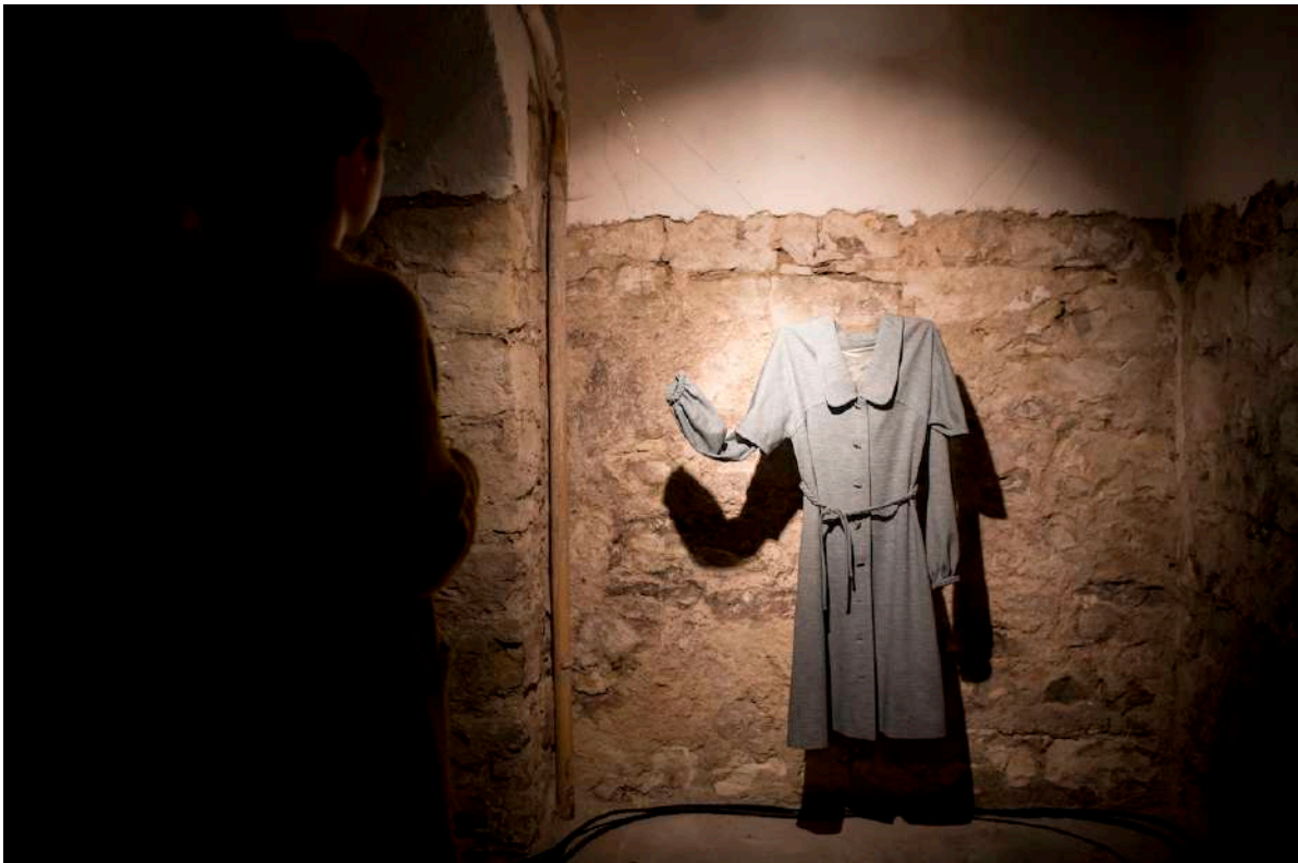
Osudety: In the Middle of Nowhere

Projekt OSUDETY: In the middle of nowhere se uskutečnil 17.-19.7.2019 v Kampusu Hybernská v rámci festivalu Nultý Bod. K realizaci jsme si vybrali sklepní prostor, který v té době ještě nebyl otevřen veřejnosti. Byl čerstvě po rekonstrukci a jeho další využití našel Kampus až po naší realizaci.