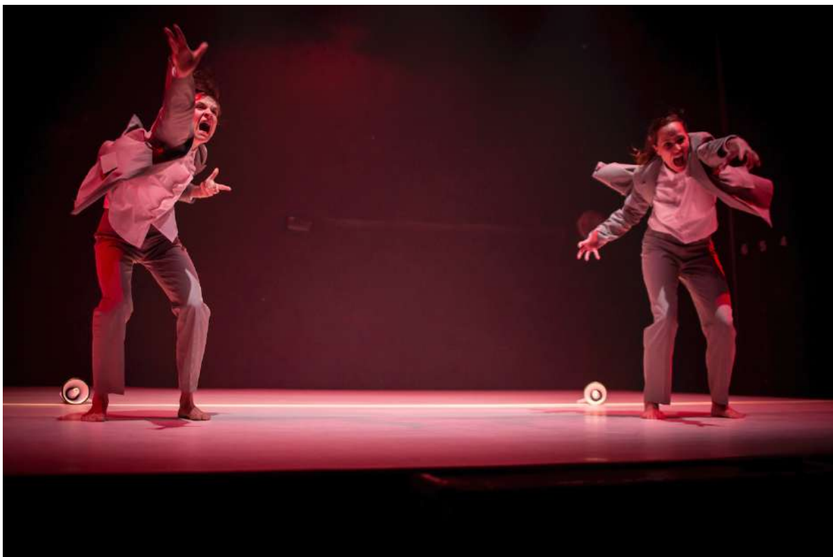
Emergency Dances I. / Patologie médií: Jáma Lvová