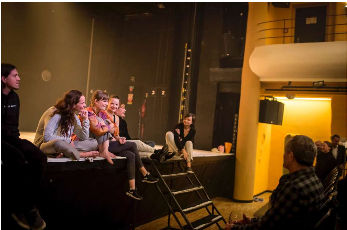
Diskuse po Emergency Dances I.