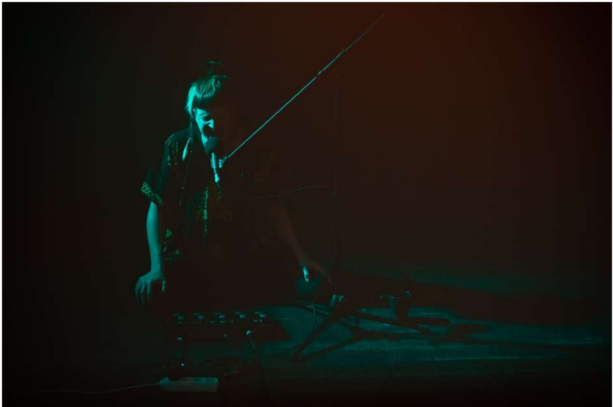
Emergency Dances II. / Limity Tělesnosti: Not to Take a Prayer