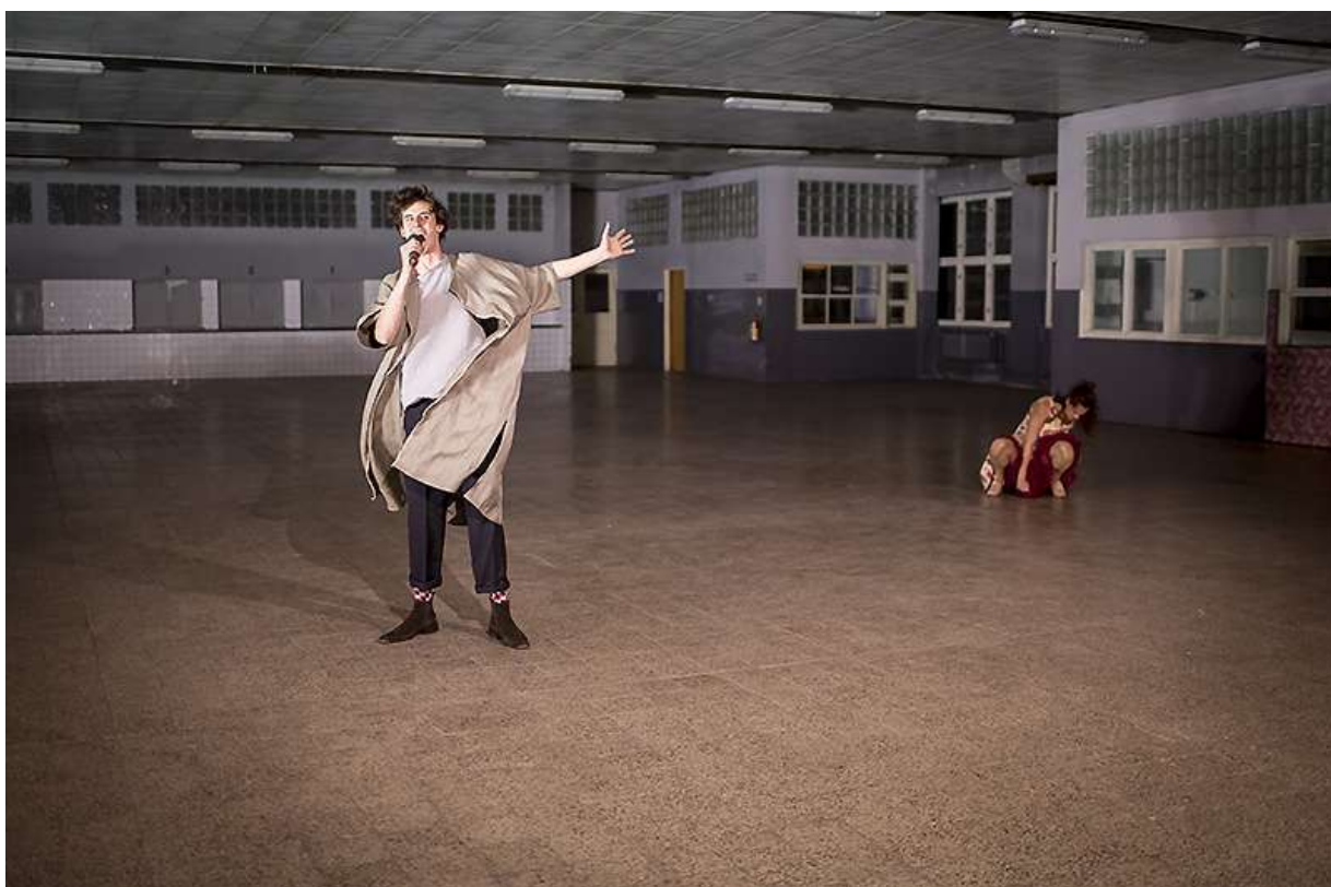
Family Therapy / !O!

Family Therapy je dlouhodobý projekt, který započal v červnu 2017 auditionem, na kterém jsme vybrali 9 mladých performerů a 4 výtvarnice. S nimi jsme jeden a půl roku blokově pracovali na výzkumu a tvorbě představení založeném na problematice psychických poruch a sociálních problémů. Od léta 2017 proběhlo 8 zkušecích bloků a poslední intenzivní měsíc zkoušení v prostoru, kde se představení uskutečnilo. Premiéra proběhla v pražské Pragovce dne 2.10.2018. V roce 2019 projekt pokračoval realizací podrobných webových stránek projektu ( www.familytherapy.cz ), 5 reprízami ve dnech 19.-23.3. opět v budově bývalé Pragovky a ním speciálním uvedením v Hradci Králové v rámci festivalu Evropských regionů.